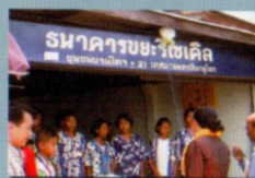
ธนาคารขยะ