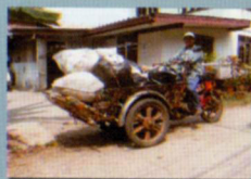
ชาเล้งรับซื้อขยะ