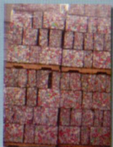
กระเบื้องกลับคืนโรงงาน เพื่อหลอมใหม่